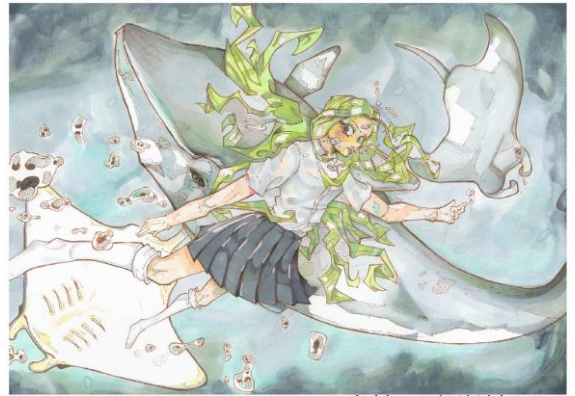
行先：国立第二中学校

オリエンテーションで「ボランティア活動について」「活動の選び方」「活動時のマナー」等を学び、メニュー表から 自分の興味のある活動先を選びます