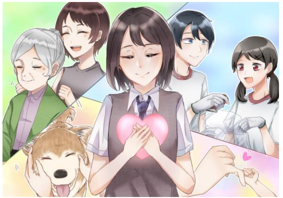
行先：都立第五商業高校