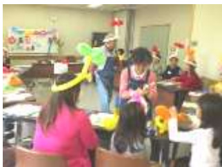
3月スキルアップ講座での様子